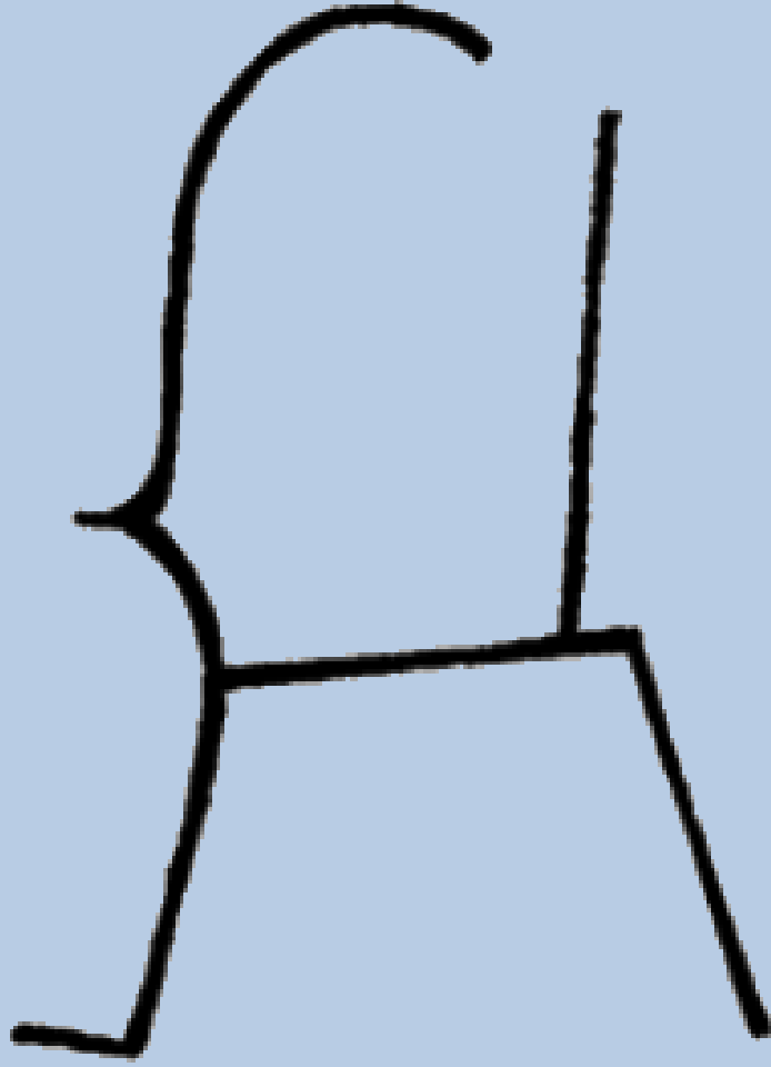
Aşina Tamgası (Damgası)